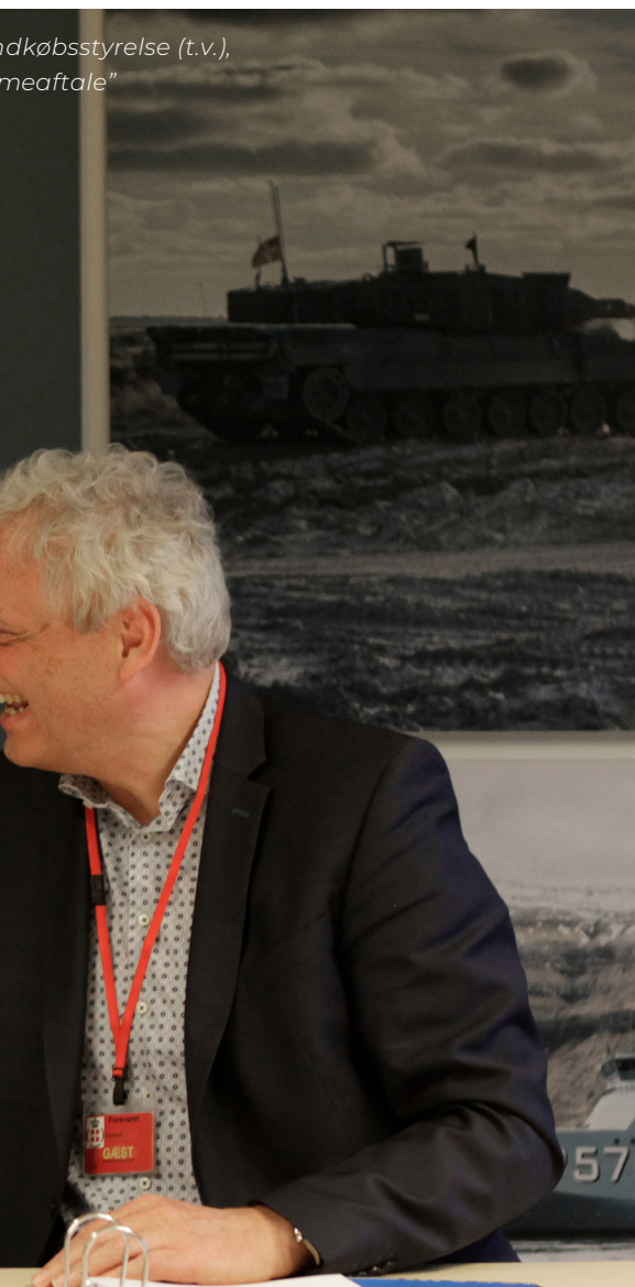
adkøbsstyrelse (t.v.), meaftale”

”Den største enkeltstående effekt af SitaWare, var for os, da det stod klart, at vi kan forbedre vores operationer, fordi vi kan dele informationer mellem værn i realtid. Vi bruger SitaWare på tværs af alle tre domæner – Flyvevåben, Hæren og Søværnet. Det betyder,