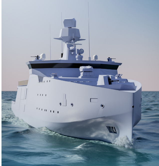
Illustration af nye patruljeskibe til Søværnet

som med input fra Søværnet, skal designes og leveres af Danske Patruljeskibe. ’Med produktsystemet og familieskabet til eksisterende danske og udenlandske skibe, kan fremtidens nye teknologier integreres på en robust og sikker designplatform’ , siger Kåre Groes Christiansen, CEO OMT. Nye teknologier omfatter blandt andet klimavenlige fremdrivningssystemer, modularitet og droner, som alle skal integreres med et robust og stabilt produktsystem udviklet specifikt for flådeskibe.