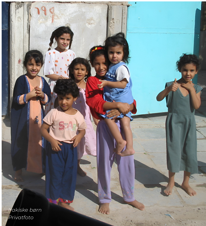
Irakiske børn Privatfoto

"Vi oplevede konstant fremgang, mens vi var der. Vi vandt deres tillid. Vi var de eneste til at sørge for, at genopbygningen kom i gang. Vi sørgede for vand, og vi hjalp dem med at komme af med deres afgrøder. Vi fik åbnet bankerne og bevogtede dem. Fik bygget et kø-system op. Så kom der gang i pensionsudbetalinger, hvilket ikke havde fundet sted i meget lang tid. Pensionen skulle vi jo have ud og flyde i samfundet,