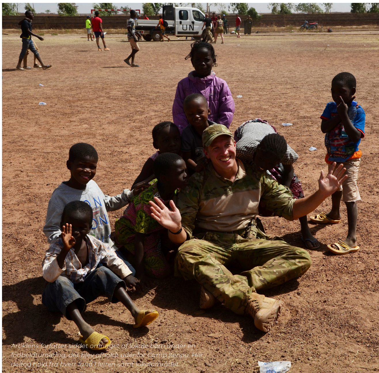
Artiklens forfatter sidder omringet af lokale børn under en fodboldturnering, der blev afholdt udenfor Camp Senou. Her deltog hold fra hvert land i lejren samt lokalområdet.