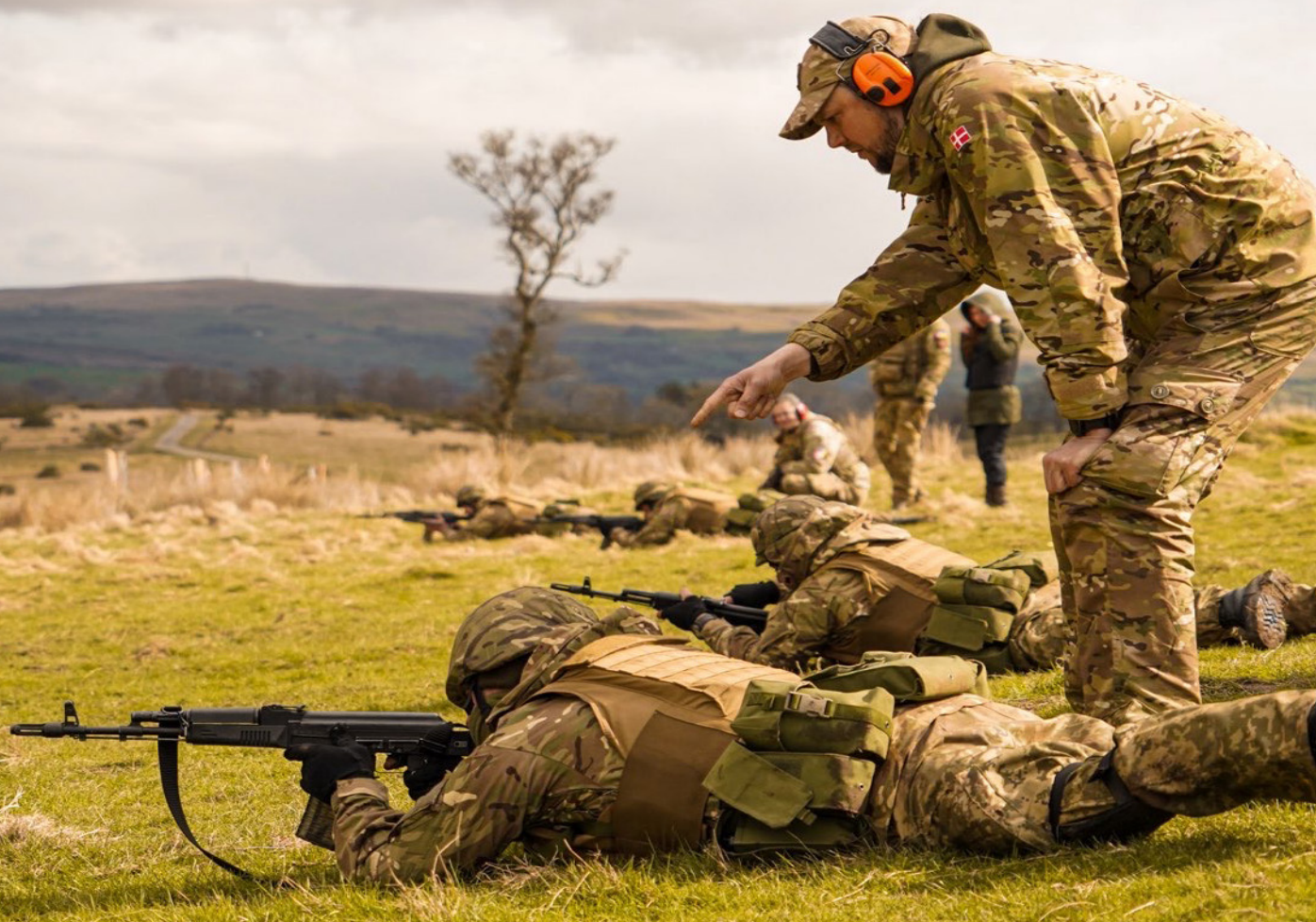
En dag på skydebanen Privatfoto.

Vi står så tæt på fronten, som vi kan, uden selv at være der, og når vi siger farvel til holdet efter fem uger, så er det med en viden om, at vi ikke kommer til at se dem igen. Selv om vi ikke bliver personlige med ukrainerne, så skal man være følelseskold, hvis man ikke bliver rørt, når man sender et hold afsted.