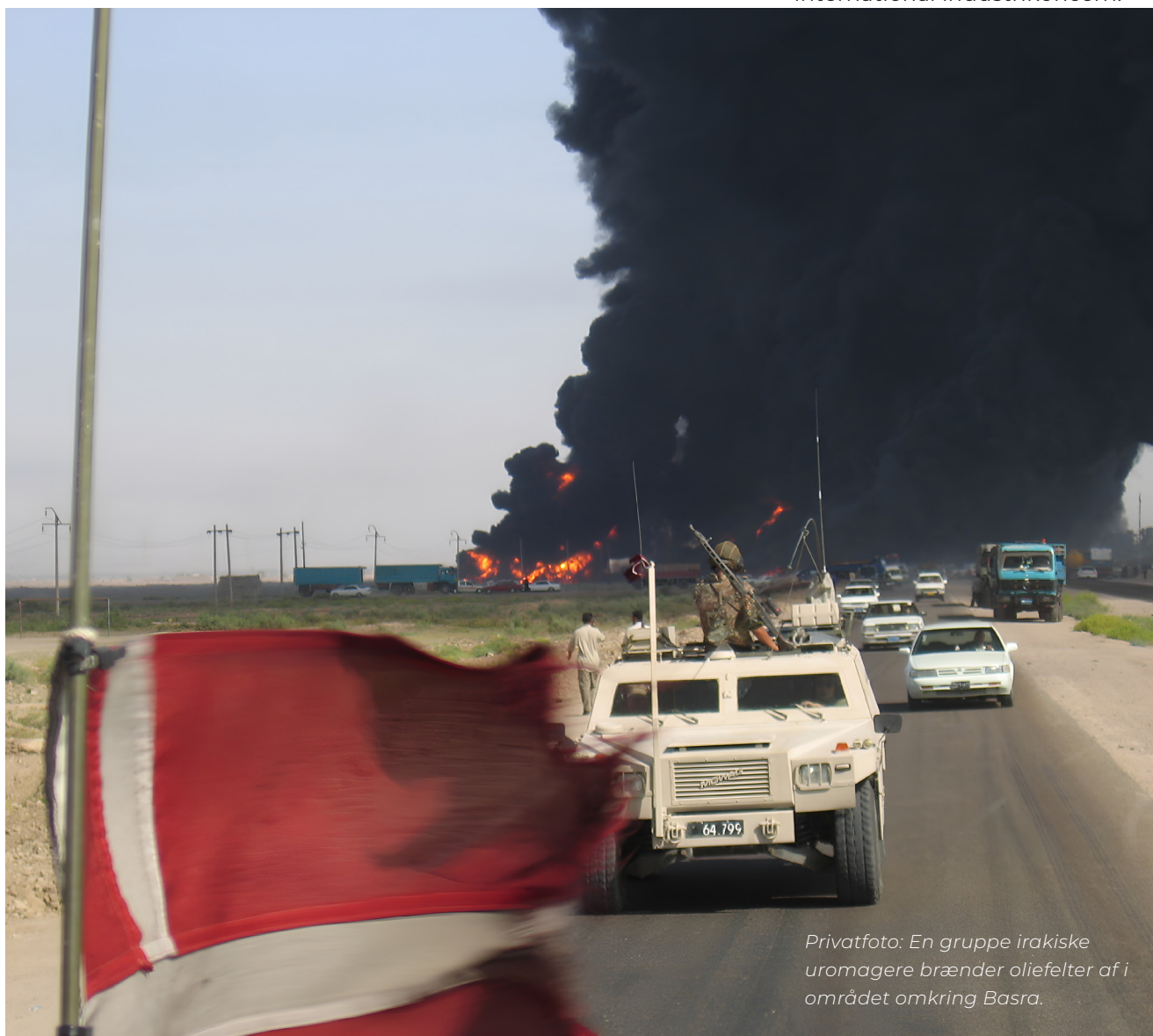
Privatfoto: En gruppe irakiske uromagere brænder oliefelter af i området omkring Basra.

Livet som færdiguddannet maskinmester startede til søs, han sejlede hos Mærsk på Sydamerika og Fjernøsten, blev så rejsemon-tør med hele verden som arbejdsplads, og har nu hus og kone og børn og job som test-engineer i test- og udviklingsafdelingen i en international industrikoncern.