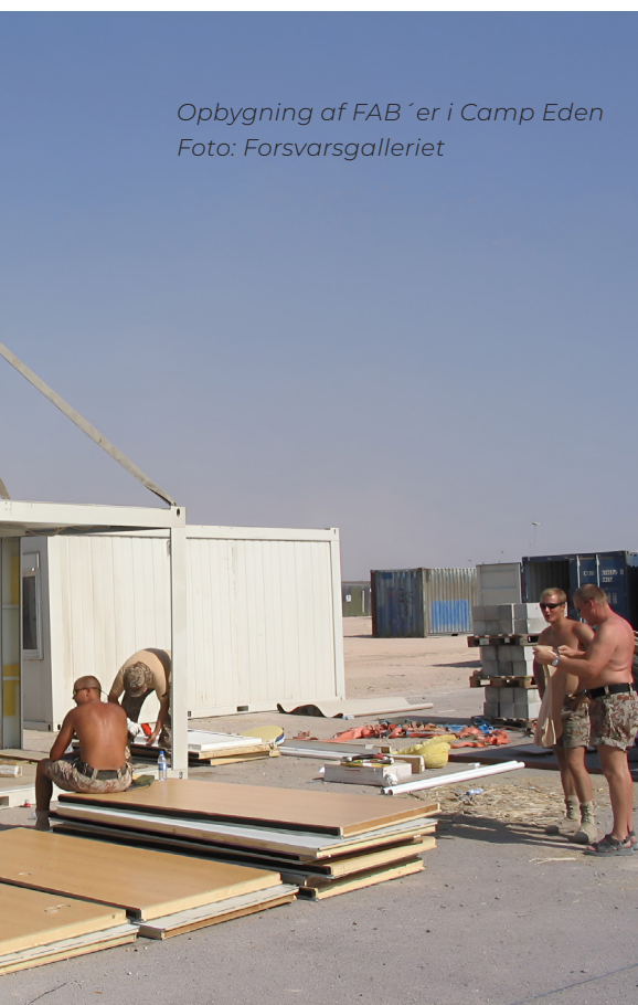
Opbygning af FAB'er i Camp Eden

Hun var 24 år, da hun tog med Hold 1 til Irak i juni 2003. Hun synes ikke, hun var udsat for noget farligt. Og så alligevel. Der var dengang, en kollega kastede sig over hende og trak hende i sikkerhed, fordi han havde set en rød prik fra en laser på hendes bryst. Og der var dengang, da unge irakiske mænd begyndte at kaste sten målrettet mod hende, "fordi de ikke kunne lide at se en kvinde i uniform."