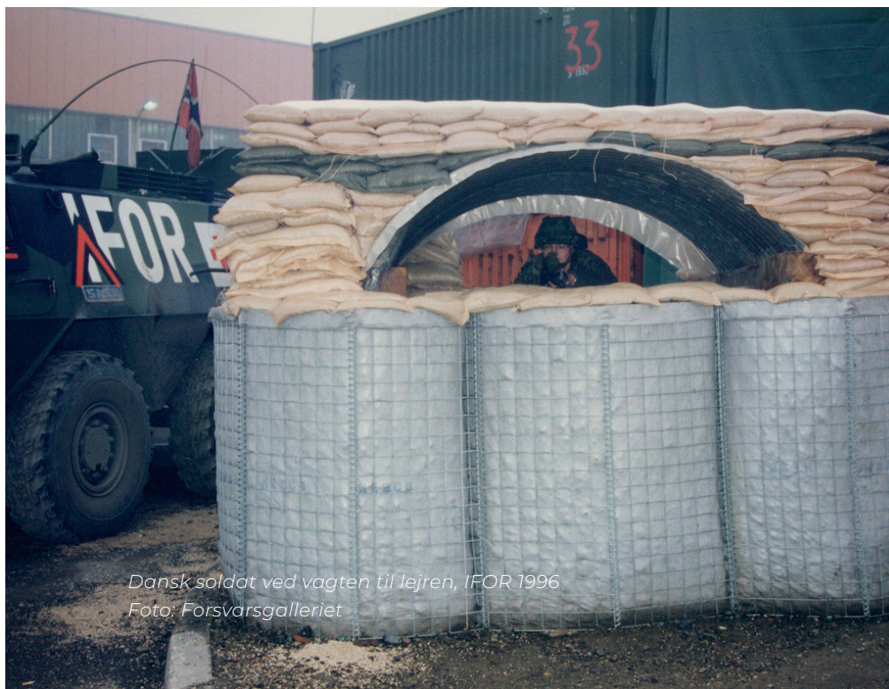
Dansk soldat ved vagten til lejren, IFOR 1996

Den nye udvikling førte til, at DANBAT blev trukket ud. Der blev indgået våbenhvile den 12. oktober, og fra det tidspunkt var det klart, at der ville blive behov for en ny FN-styrke med et robust mandat – ikke en fredsbevarende, men en fredsskabende styrke.