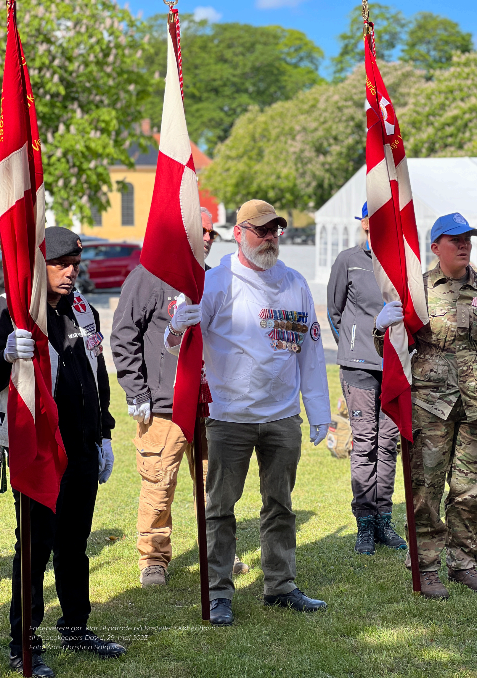
Fanebærere gør klar til parade på Kastellet i København til Peacekeepers Day d. 29. maj 2023