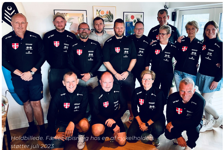
Holdbillede. Fælles spising hos en af cykelholdets støtter juli 2023