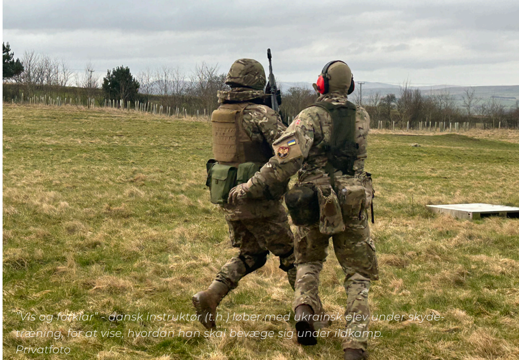
”Vis og forklar” - dansk instruktør (t.h.) løber med ukrainsk elev under skyde-træning, for at vise, hvordan han skal bevæge sig under ildkamp.

”De har et gevær, de kan bruge det, og de kan lappe hinanden sammen. Og de kan passe på hinanden i felten. Se miner og overleve på kamppladsen. Det er helt grundlæggende militærtjeneste, hvor man kan sige, vi har fjernet alt overflødig.”