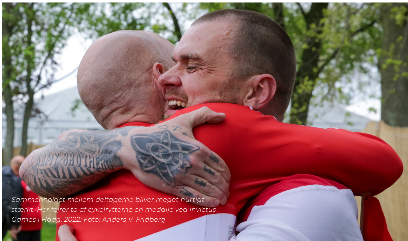
Sammenholdet mellem deltagerne bliver meget hurtigt stærkt. Her fejrer to af cykelrytterne en medalje ved Invictus Games i Haag, 2022: Foto: Anders V. Fridberg