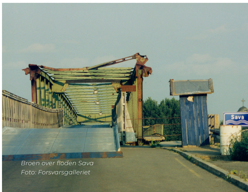
Broen over floden Sava

Kampvogneskadronen skulle placeres uden for kaserne og sikre mod eventuelle angreb fra