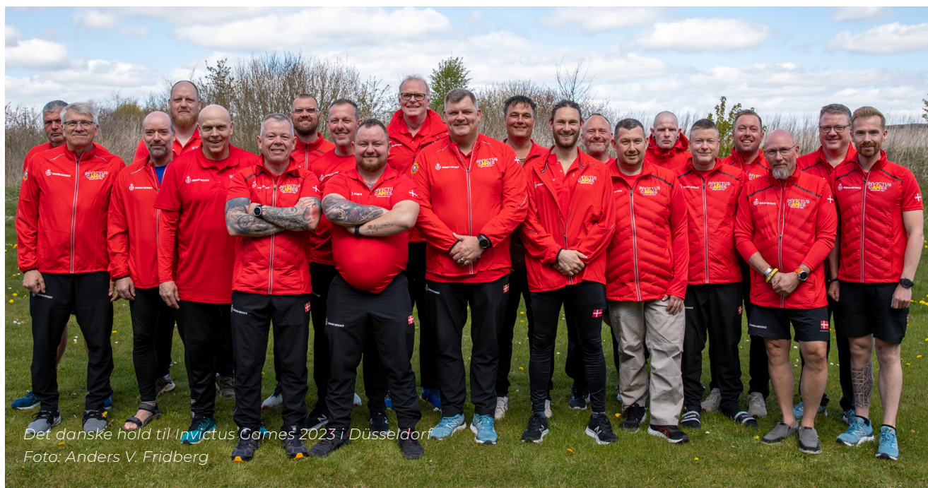
Det danske hold til Invictus Games 2023 i Düsseldorf

Første skridt var at skrive en motiveret ansøgning. Det var også