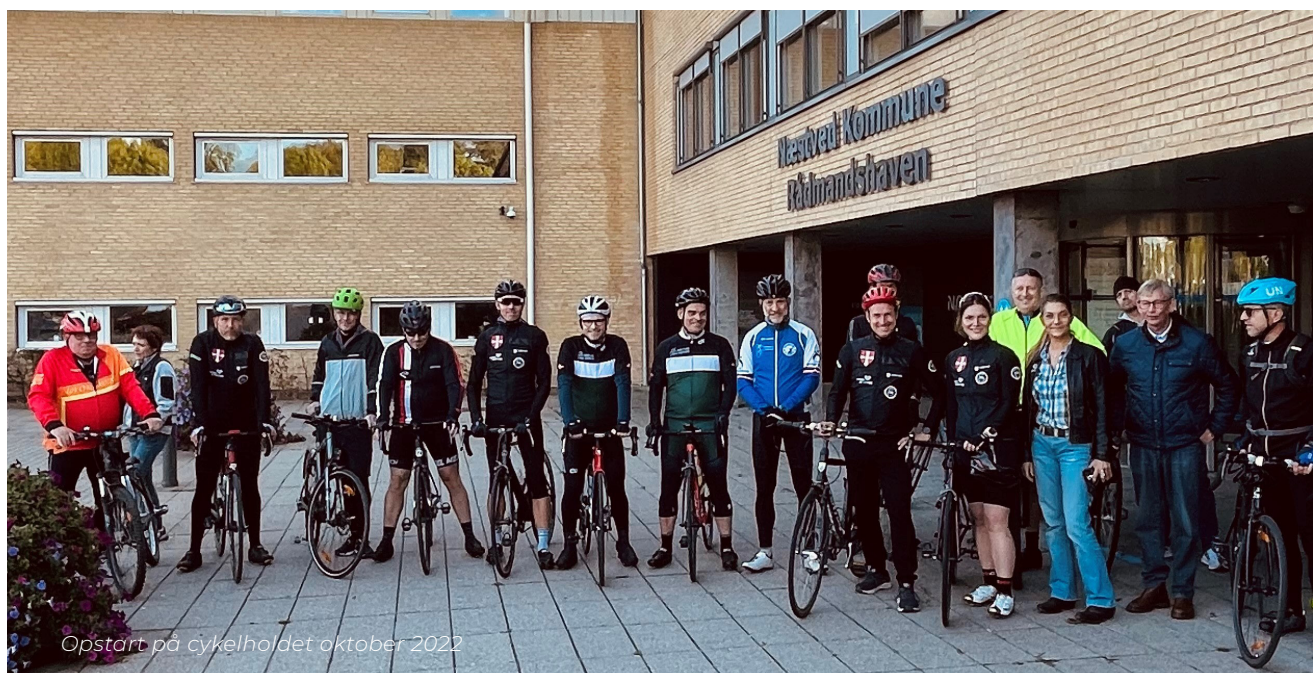
Opstart på cykelholdet oktober 2022

Nogen cykler længere og hurtigere end andre, men fokus er i høj grad på fællesskabet og sammenholdet. Det er ikke et krav, at man skal have en dyr racercykel og hvis behovet er til stede, er der også mulighed for at låne en cykel takket været det lokale erhvervsliv, Danmarks Idrætsforbunds – Dif Soldaterprojekts og Danmarks Veteraners villighed til