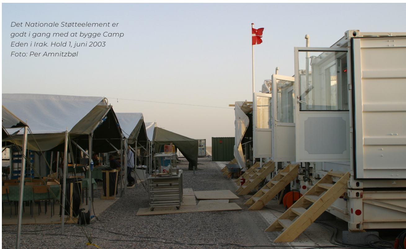
Det Nationale Støtteelement er godt i gang med at bygge Camp Eden i Irak. Hold 1, juni 2003